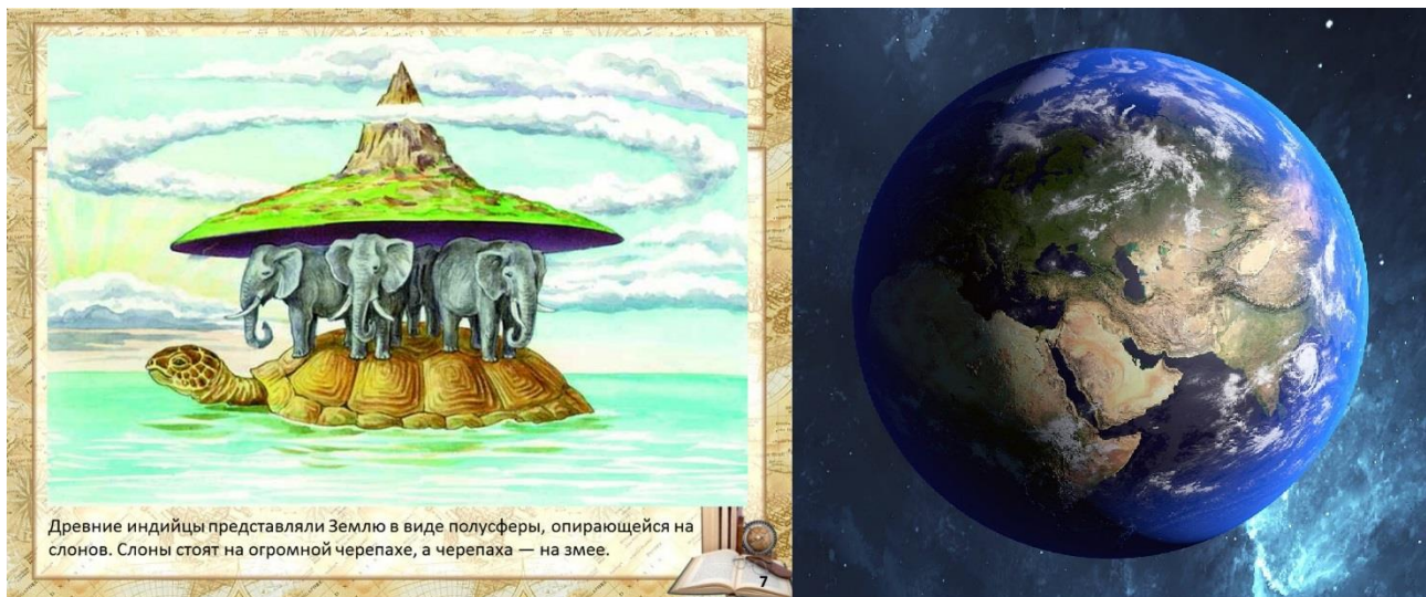
Рис.1 Земля в представлениях субъективистов и объективистов

Впрочем, какие субъективистские картины Земли не рисуй, как делали это еще, например, древние индийцы, мир вокруг человека был, есть и будет объективным. И лучшими средствами доказательства объективности мира являются его образы, полученные при посредстве технических средств, исключающих какую-либо их фальсификацию. Например, с помощью фото- и видео-аппаратов, микроскопов и телескопов.